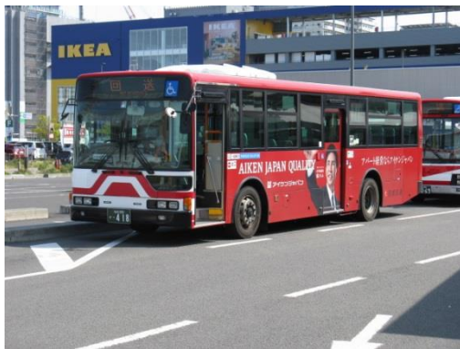
【 フララッピング 】