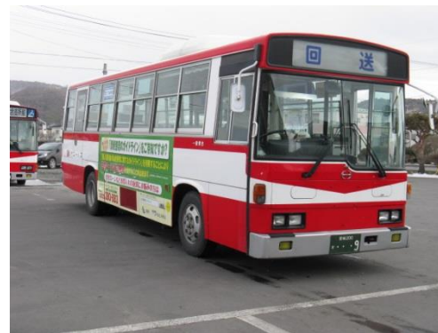
【 ハーフラッピング 】