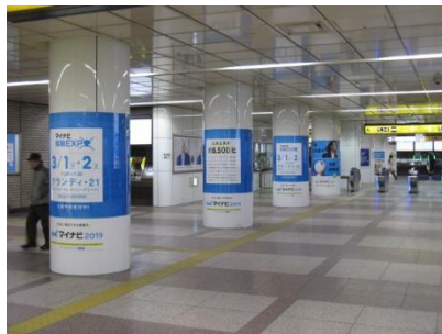
【 改札内セット 】