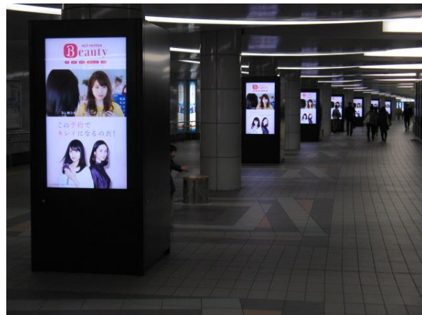
【 ピラービジョン柱7本/14面 】