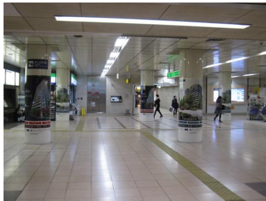
【 南口 】