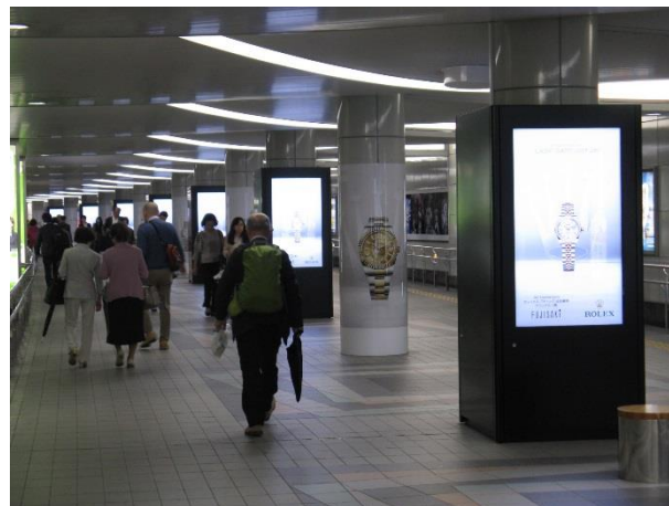
【 ピラービジョン柱7本/14面+アドピラー7本 】