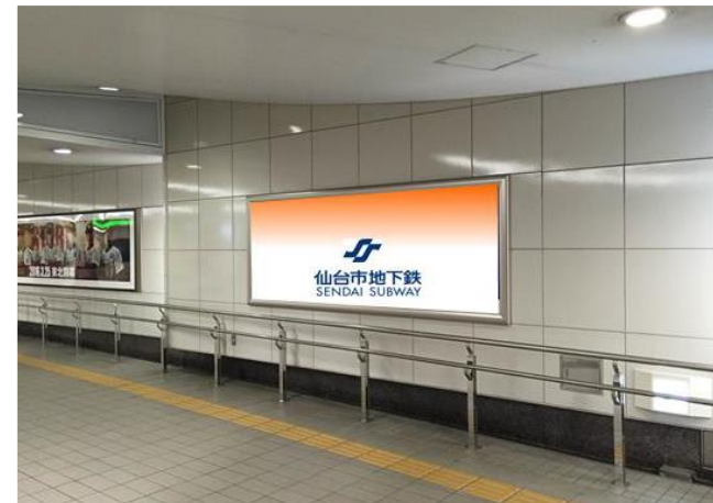
【 ピラービジョン柱7本/14面+ストリートセットボード10箇所 】