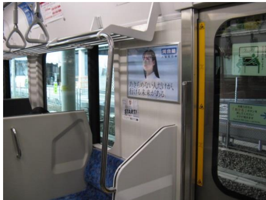
【 仙石線ドア横図 】

記 事 : 仙石線は全車両4枚一部2枚、アクセスは全車両各2枚、その他は全車両各1枚