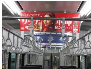
東北・仙山・常磐線