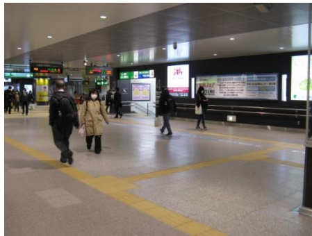
JR仙台駅2F中央改札内跨線橋

掲 出 場 所 : (A)仙台駅2F中央改札内跨線橋 (B)仙台駅東口 (C)仙台駅地下南口改札内 (D)あおば通駅 数 量 : B0ポスター又はB1ポスター 掲 出 期 間 : 期/7日間 掲 出 料 金 ( 税 込 ) : B0・期/61,600円 B1・期/30,800円 申 込 方 法 : 掲出開始日の3ヶ月前の月の15日、以降決定優先 掲 出 撤 去 作 業 : 毎日 記 事 : 取付作業は掲出開始日の前日午後からとなります。