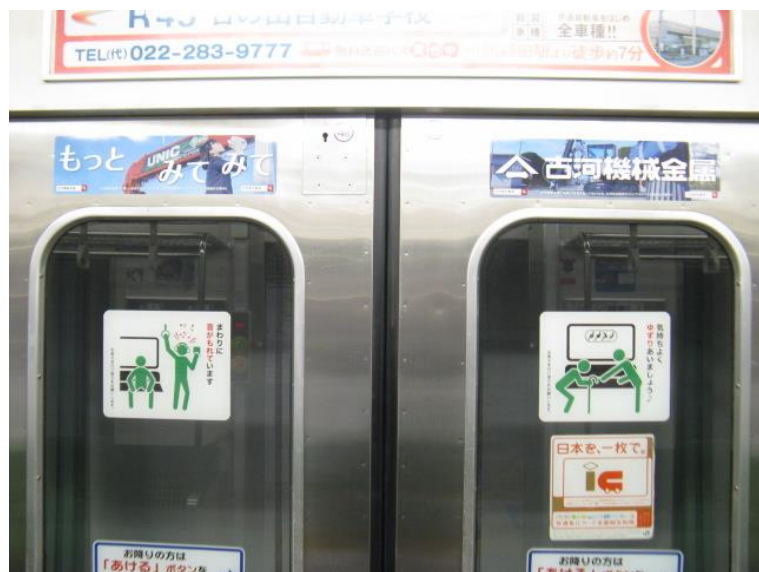
※モニターは仙石線(Lサイズ)